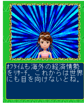
オフタイムも 海外情勢チェック