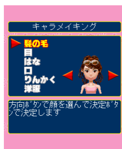
女性キャラを セレブにメイキング