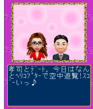
ヘリコプターで 空中遊覧!!