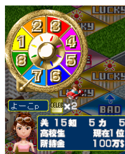
ゴールドに輝く ゴージャスルーレット